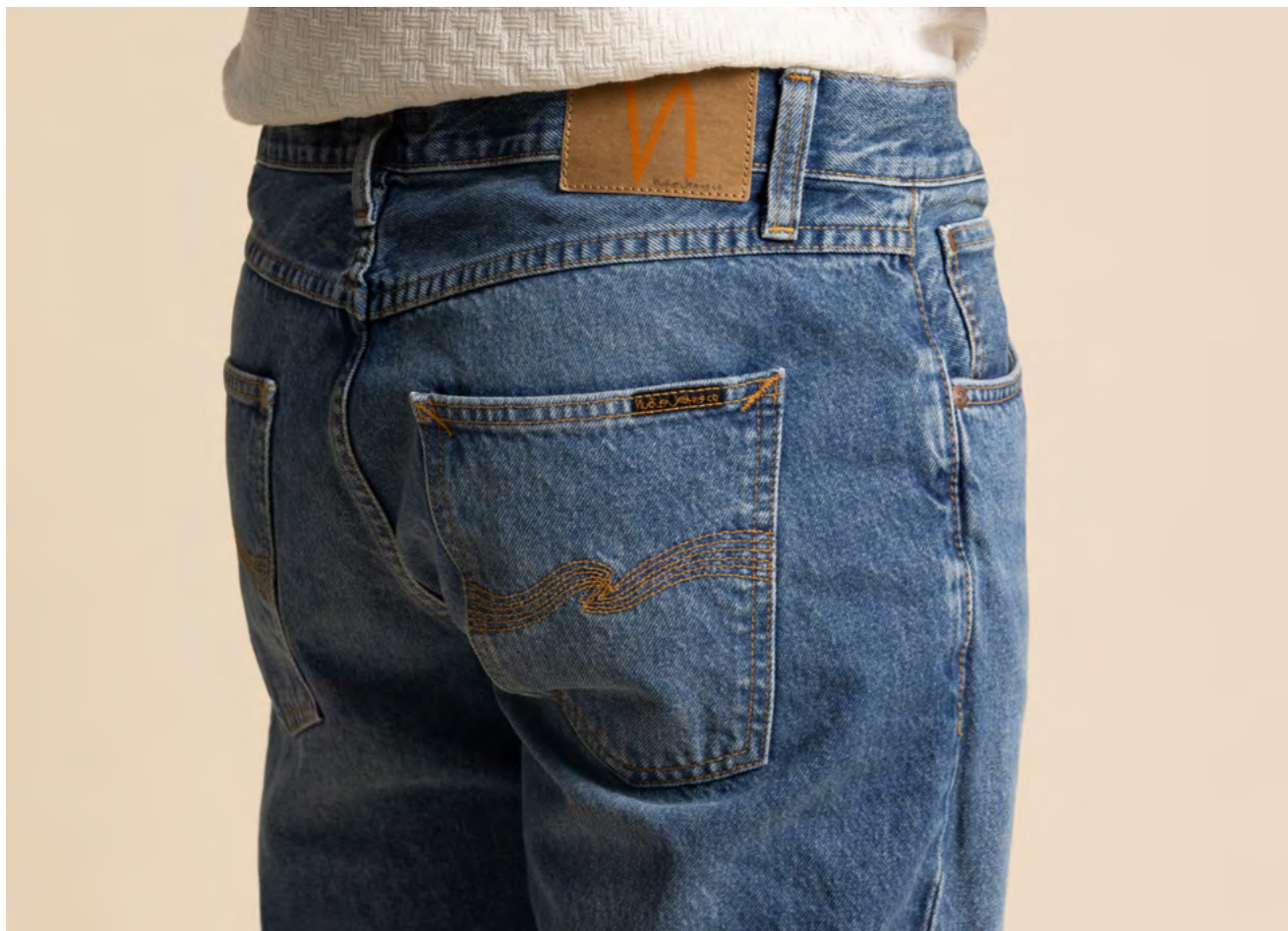
BOSS Jeans 1.400 kr.