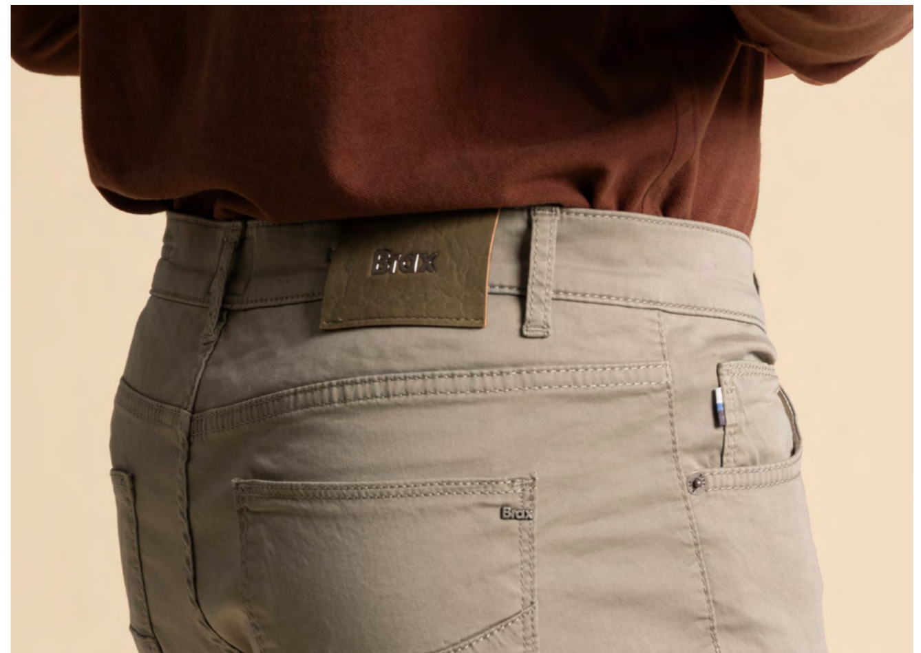
Brax 5-pocket 1.000 kr.