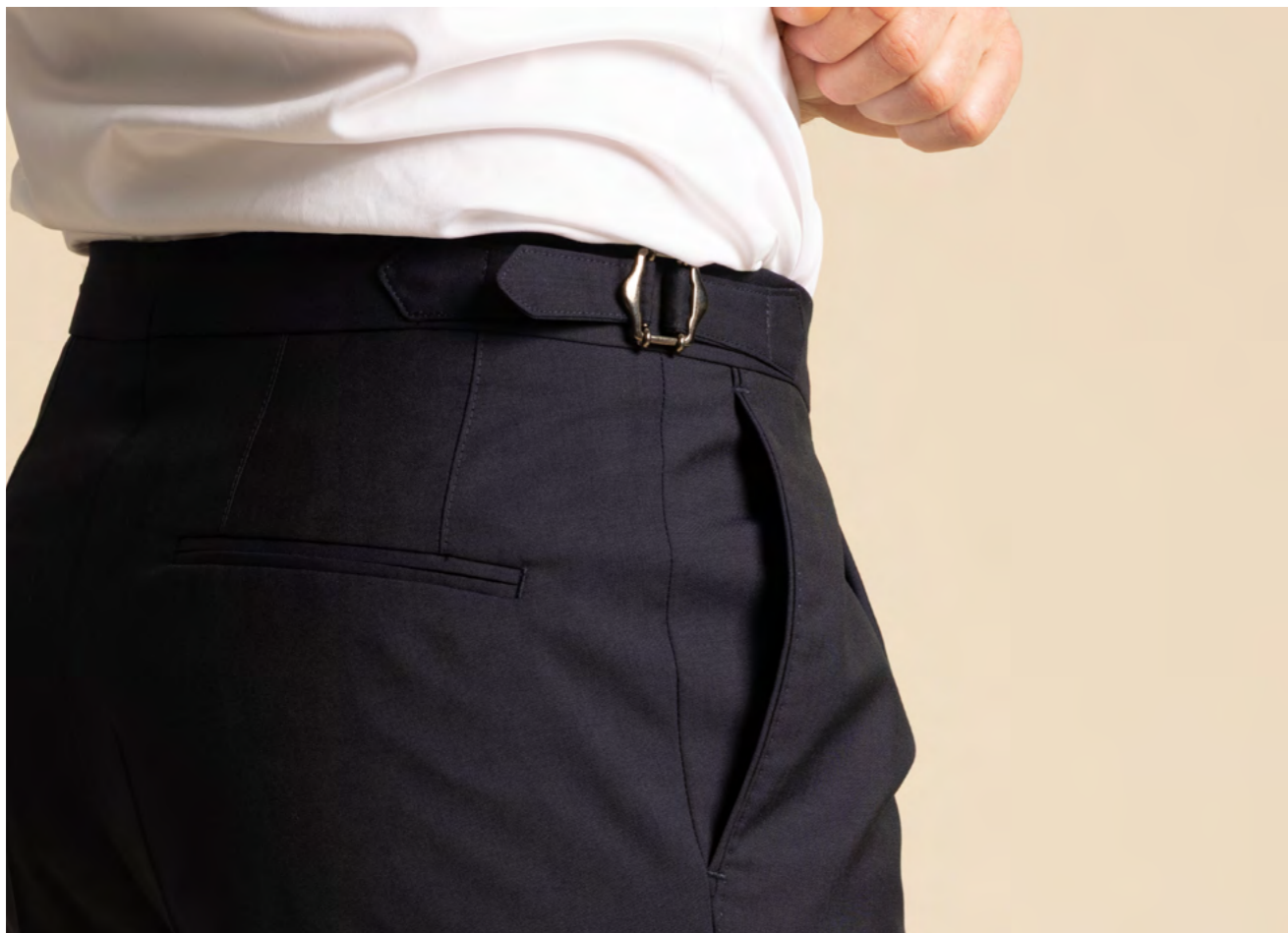
Oscar Jacobson Ulbukser 2.000 kr.