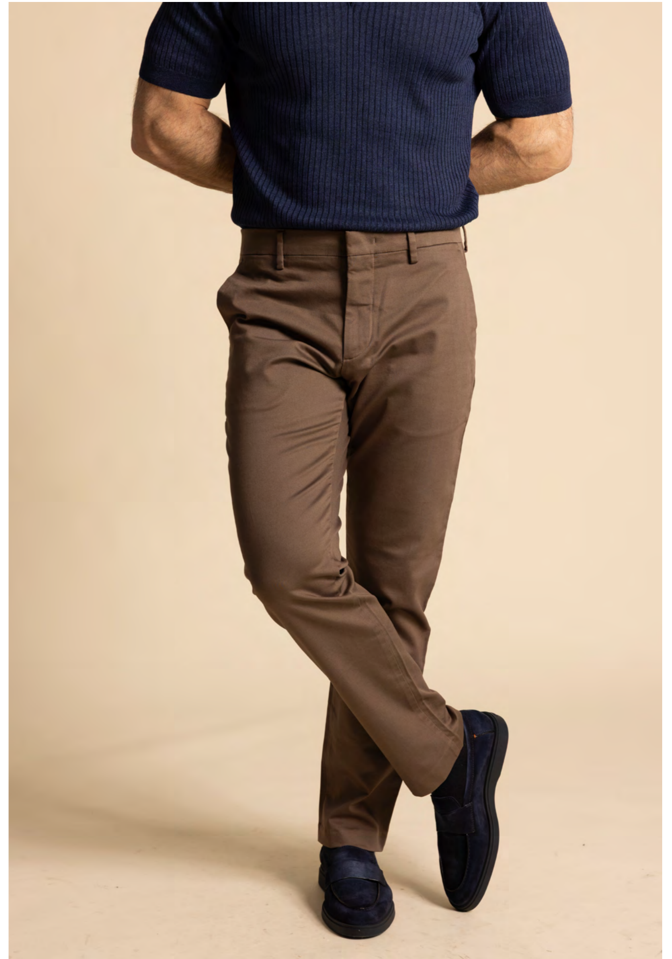
NN.07 Bomuldsbukser 1.200 kr.