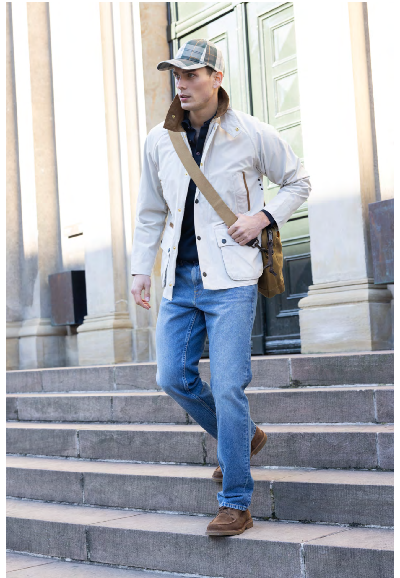
Barbour Jakke 2.600 kr.