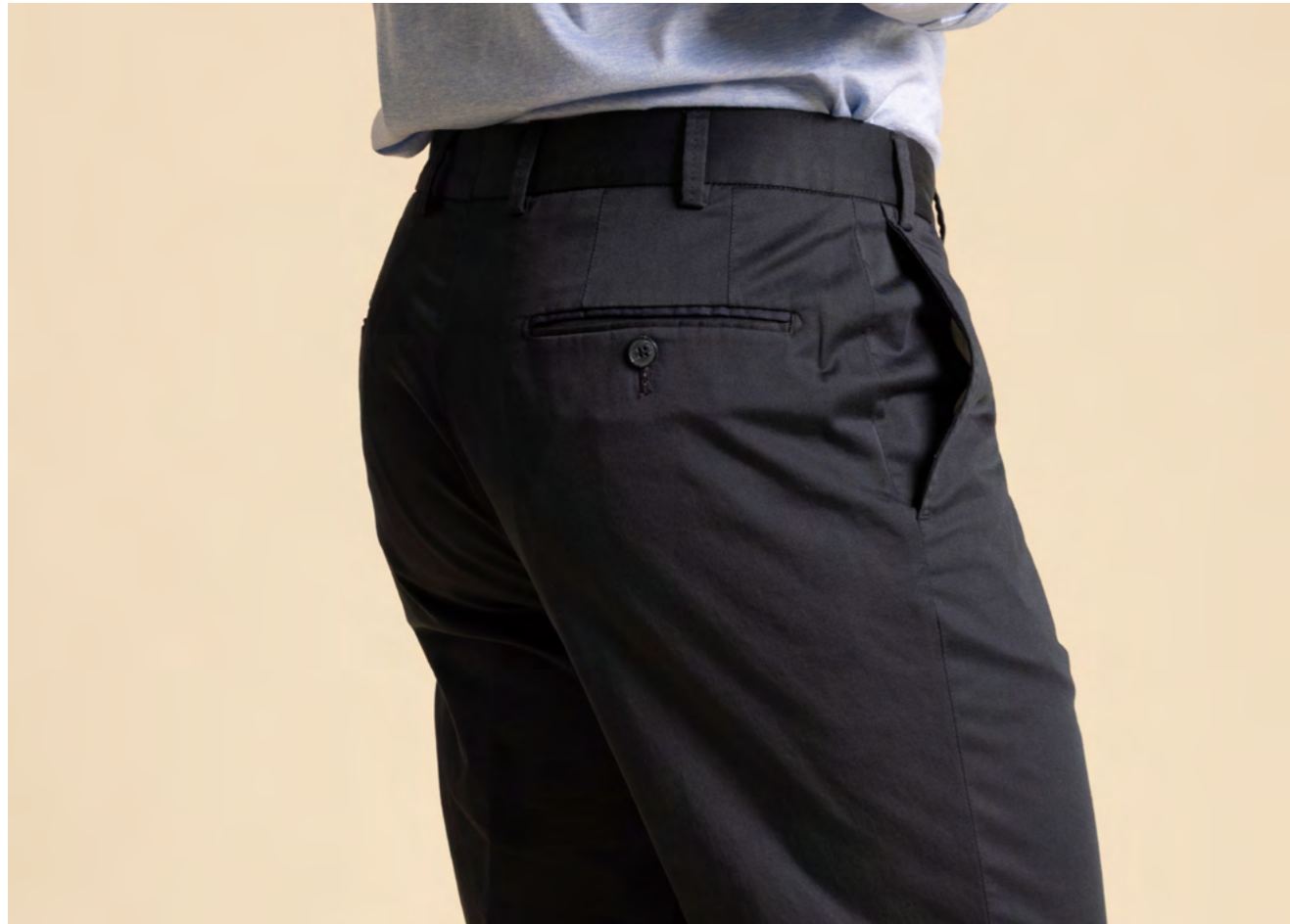
Hilt Bomuldsbukser 1.400 kr.