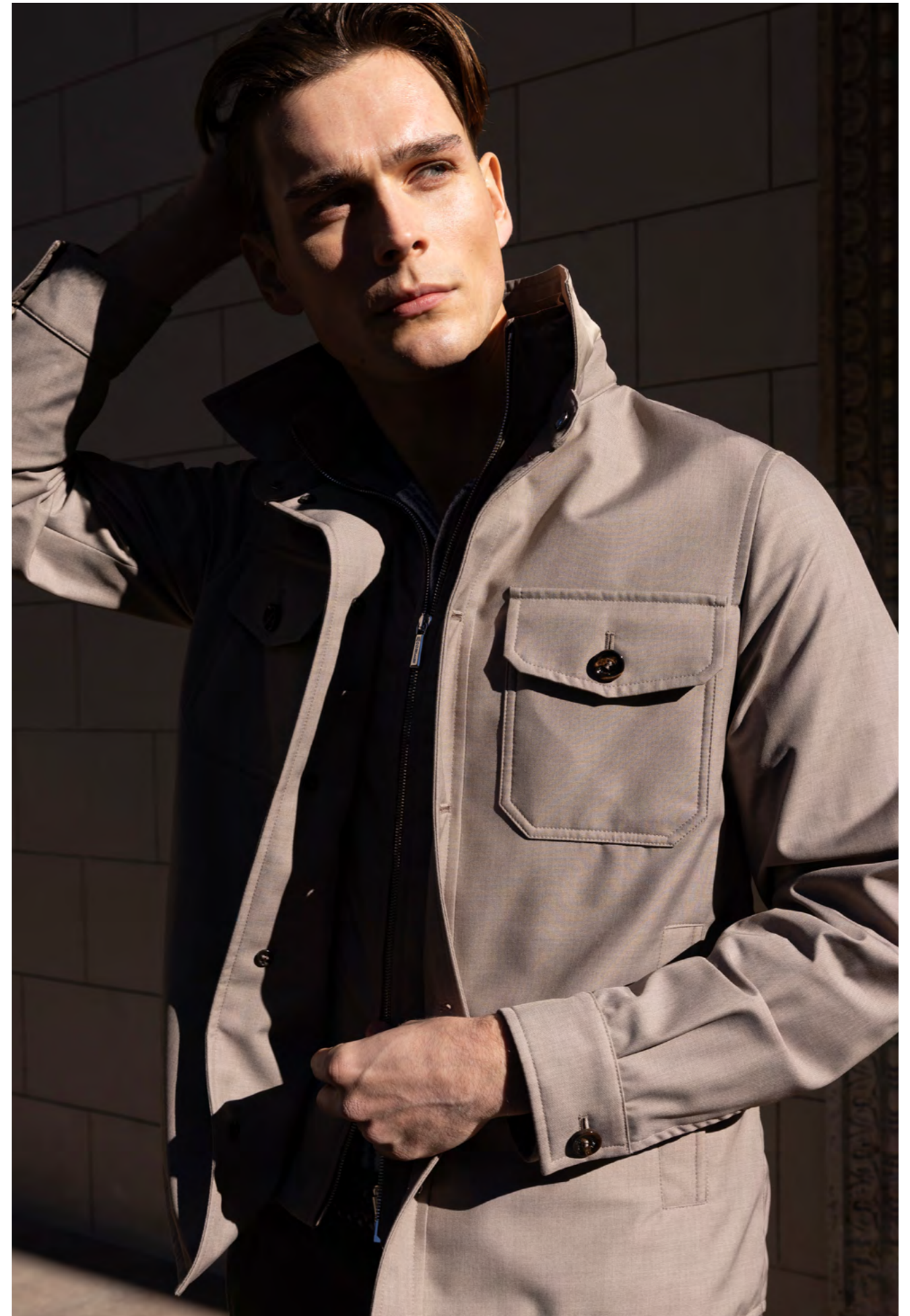
MooReR Jakke 9.200 kr.