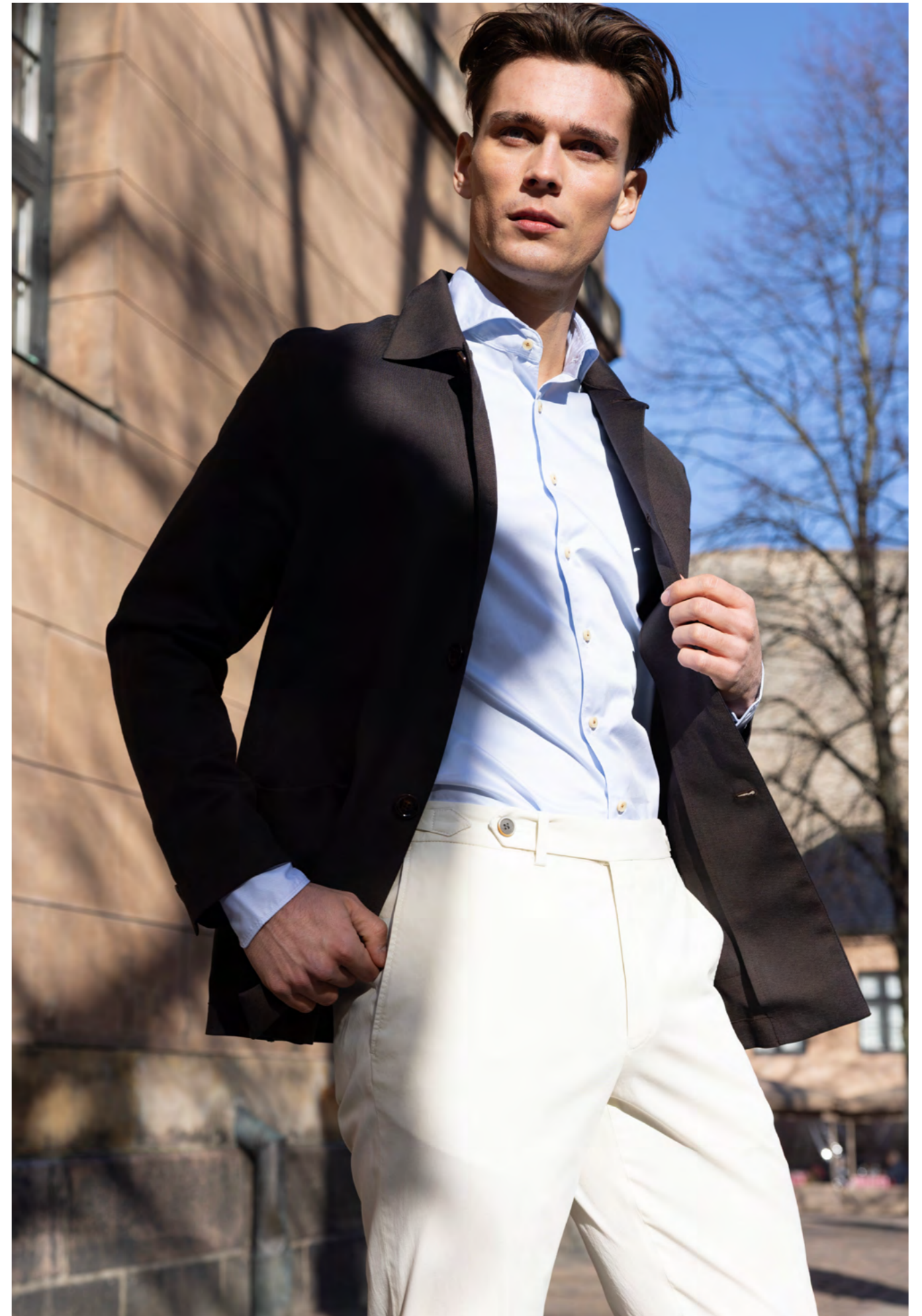
MooReR Skjortejakke 7.000 kr.