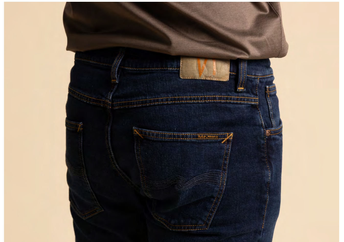
Nudie Jeans Jeans 1.200 kr.