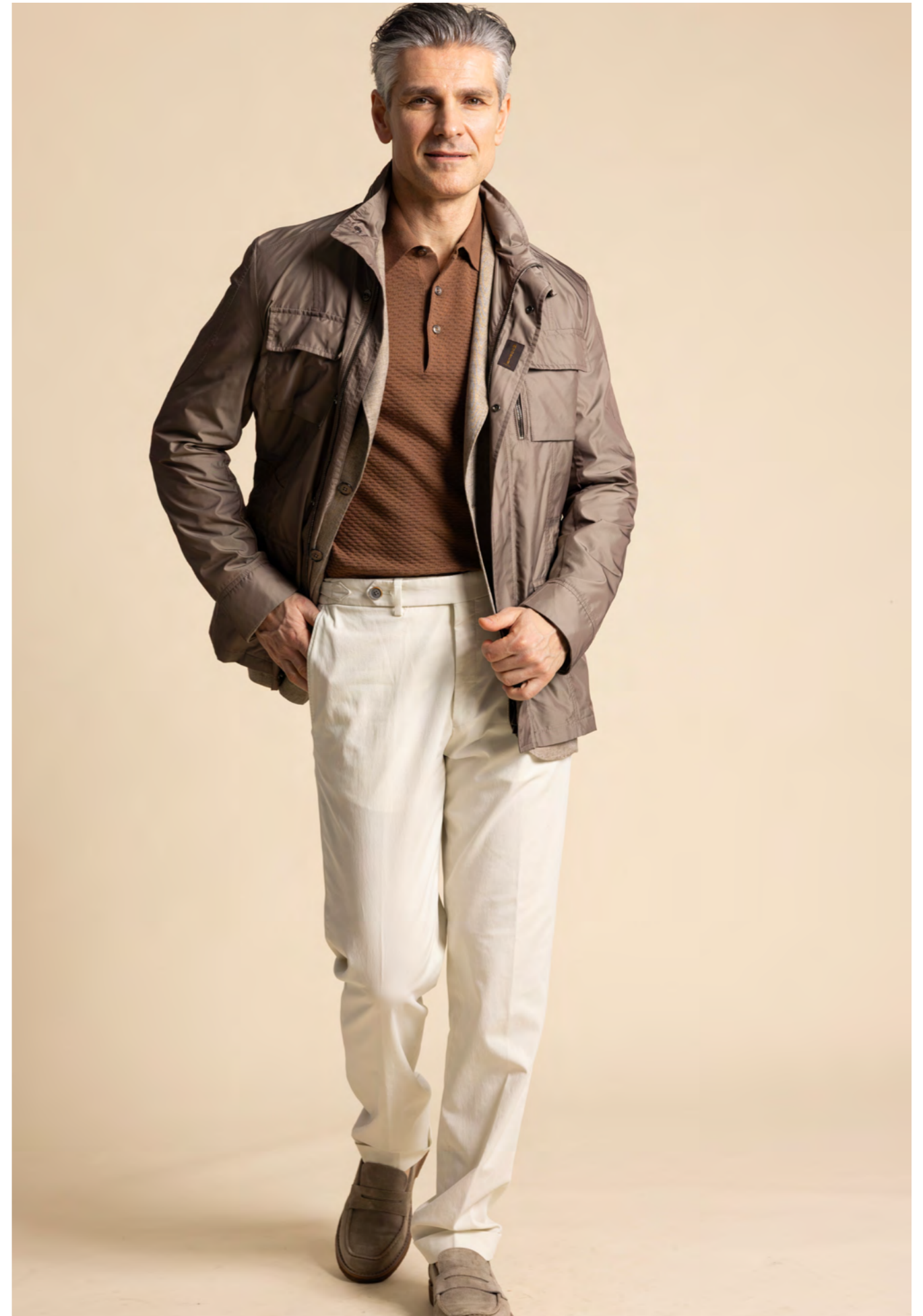
MooReR Field Jacket 7.300 kr.