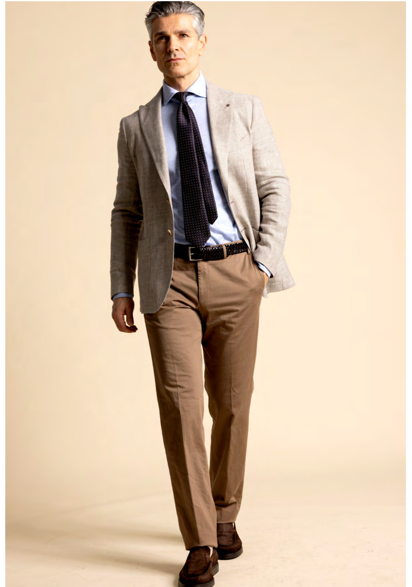
Tagliatore Blazer 5.200 kr.