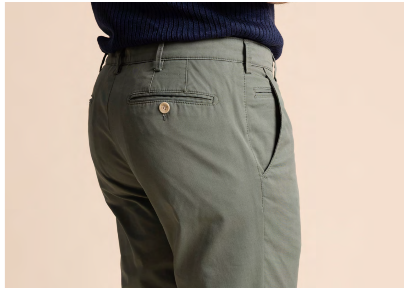
Meyer Bomuldsbukser 1.000 kr.