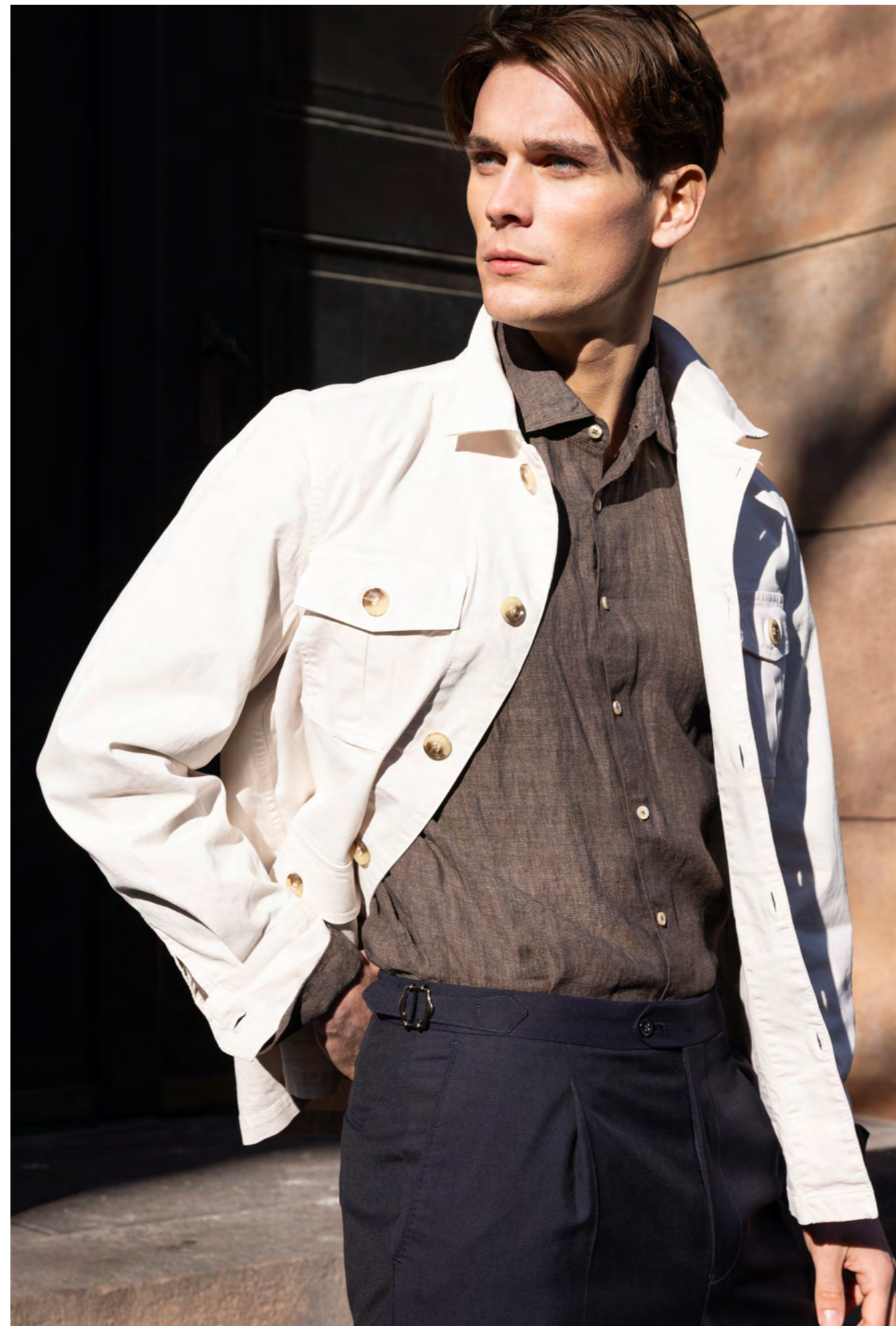
Oscar Jacobson Skjortejakke 1.600 kr.