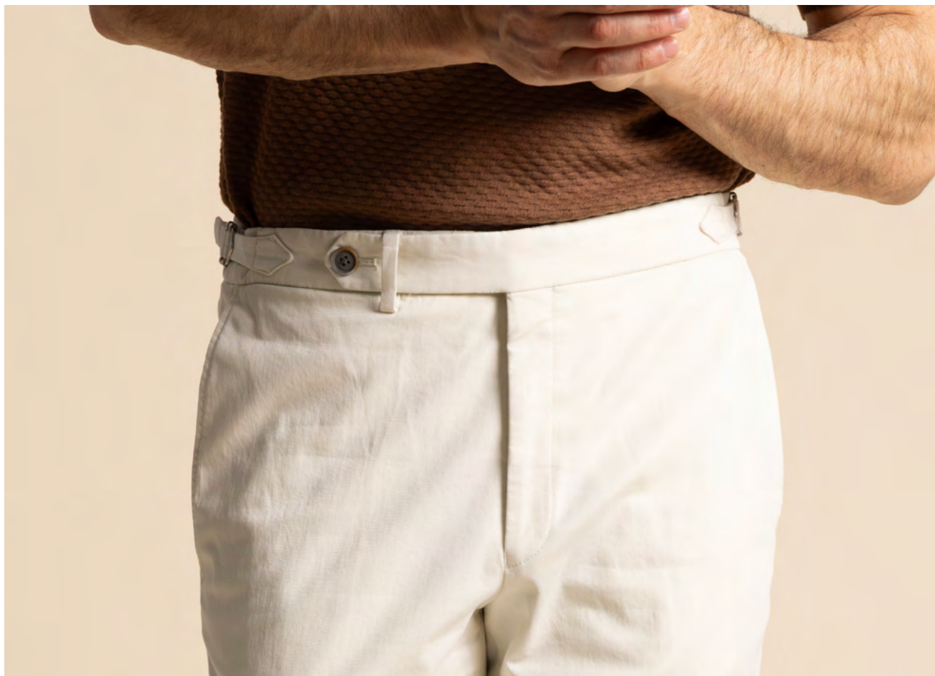
Hilt Bomuldsbukser 1.600 kr.