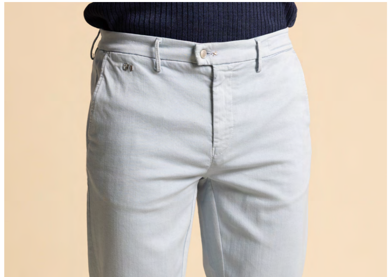
Tramarossa Jeans 2.300 kr.