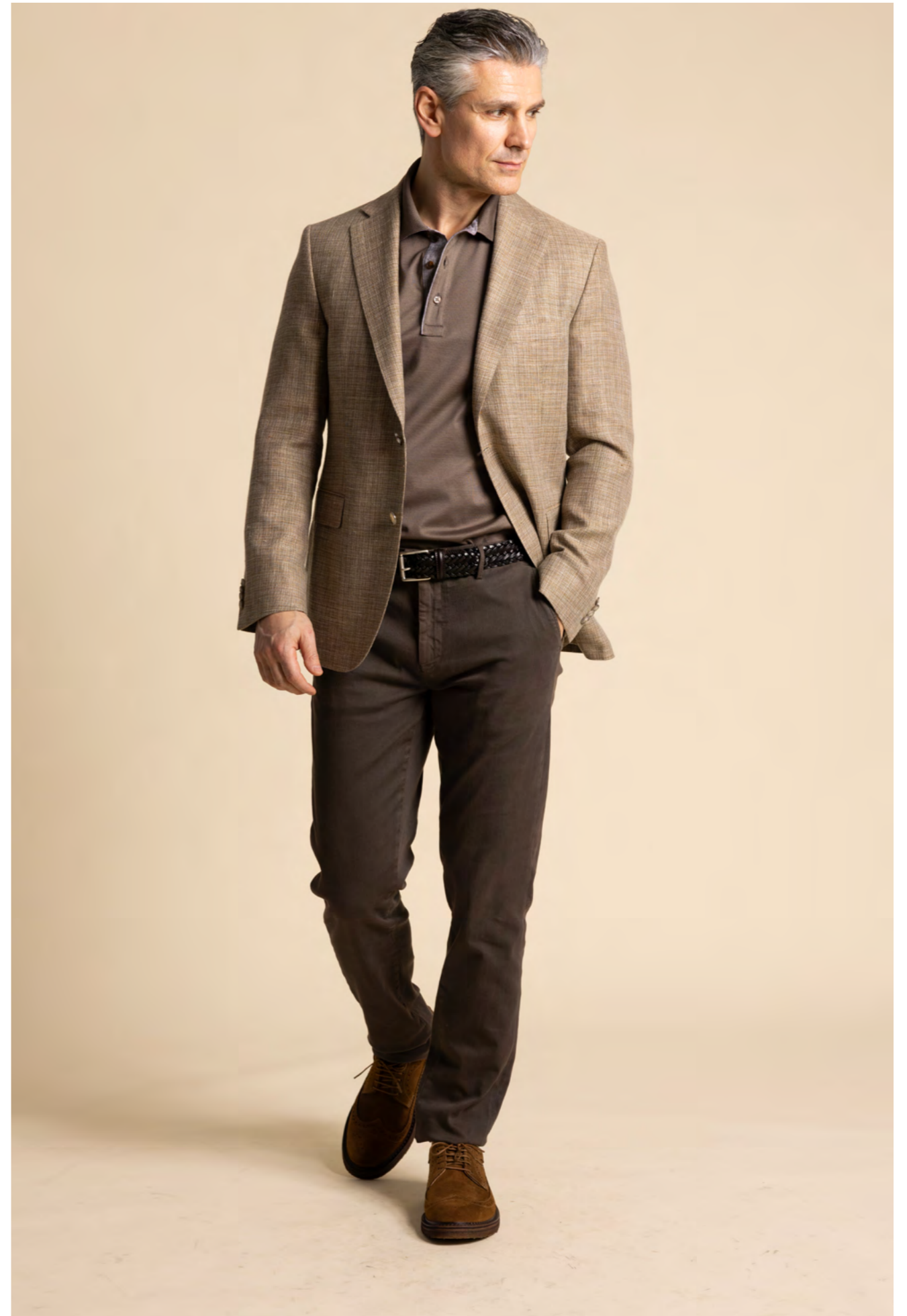
Oscar Jacobson Blazer 3.200 kr.