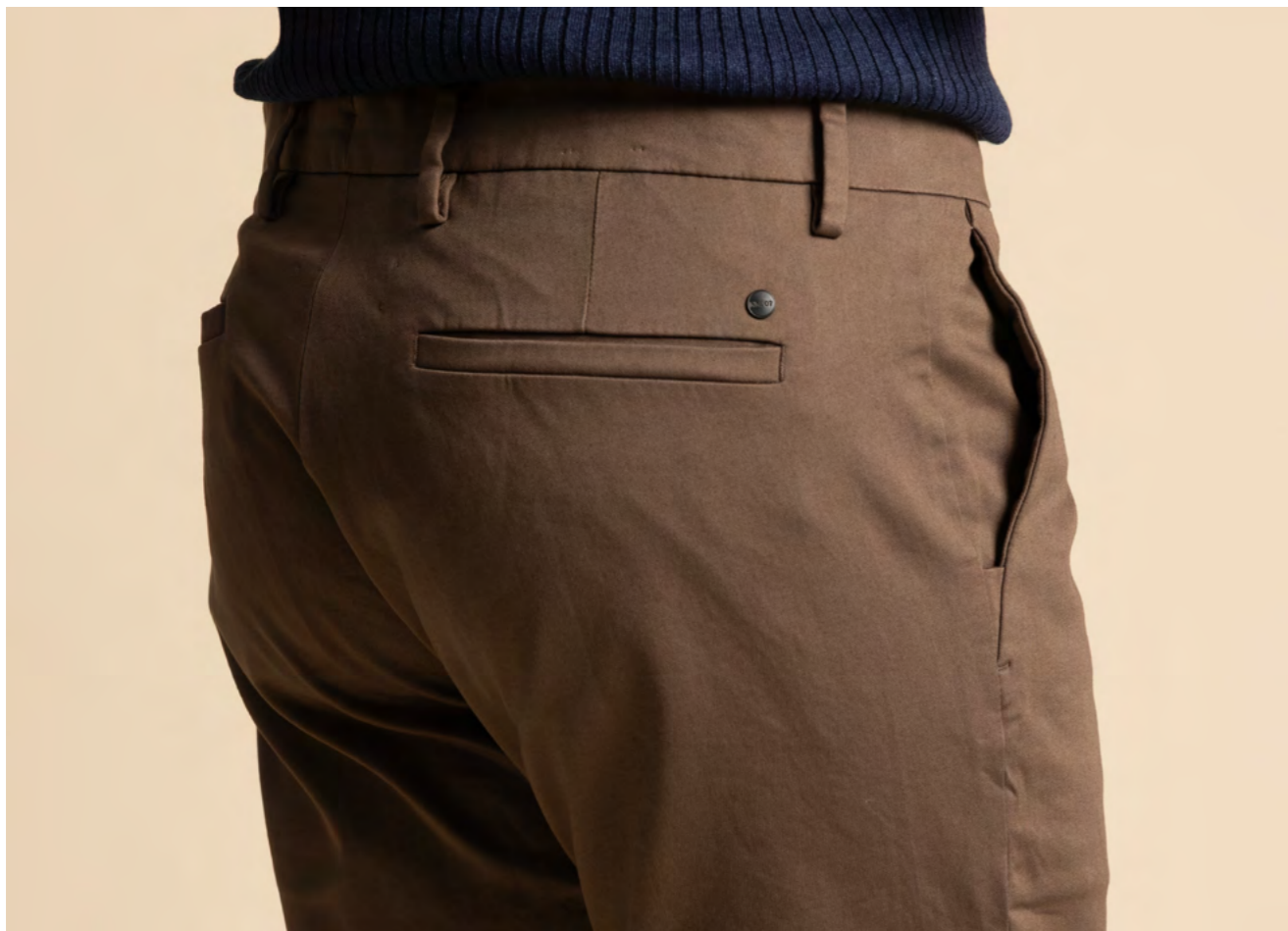
NN.07 Bomuldsbukser 1.200 kr.