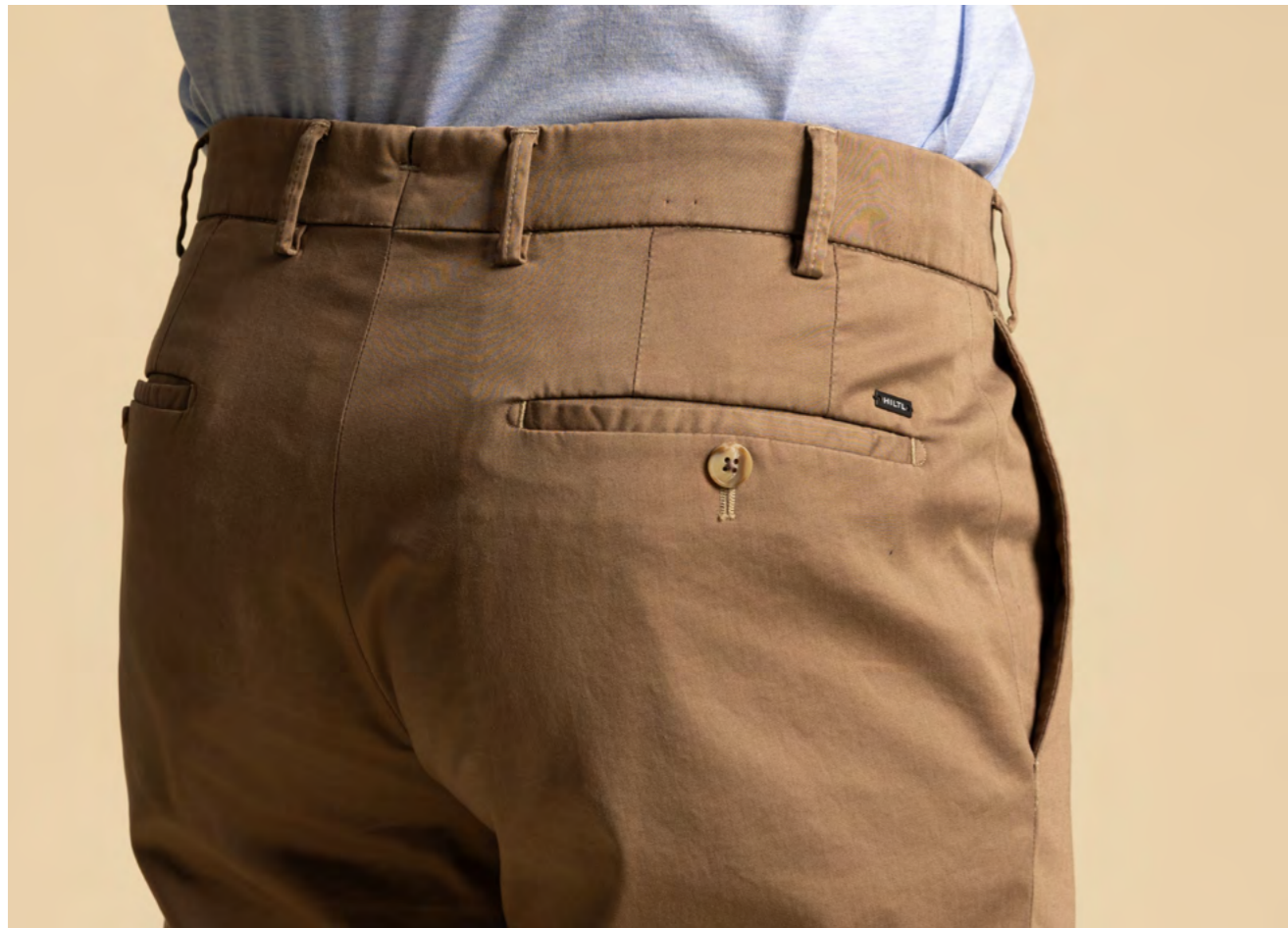
Hiltl Bomuldsbukser 1.200 kr.