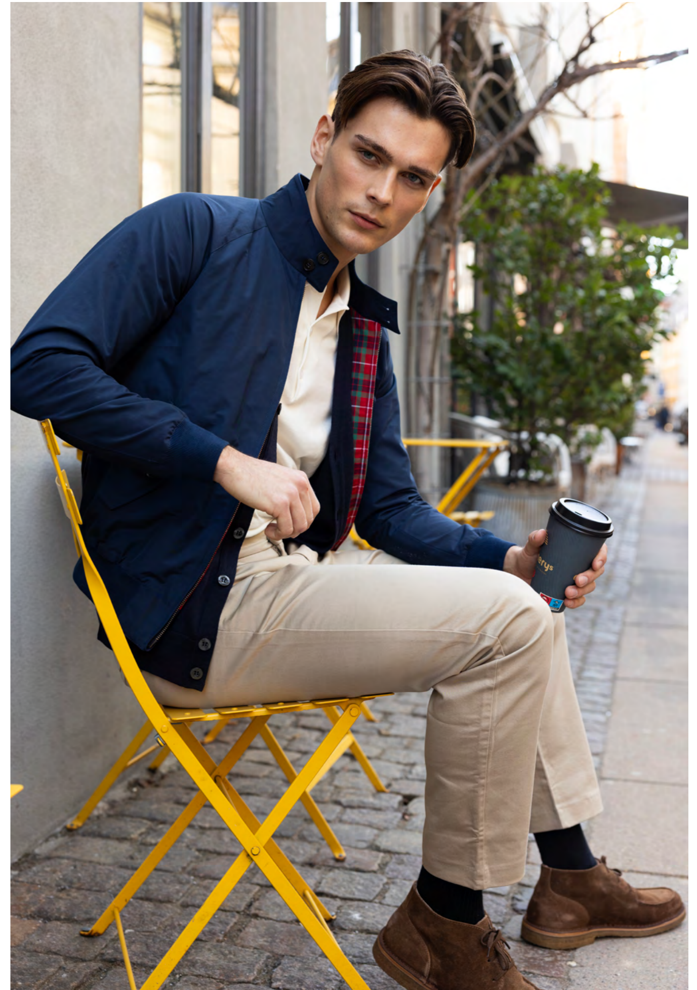
Baracuta Jakke 3.200 kr.