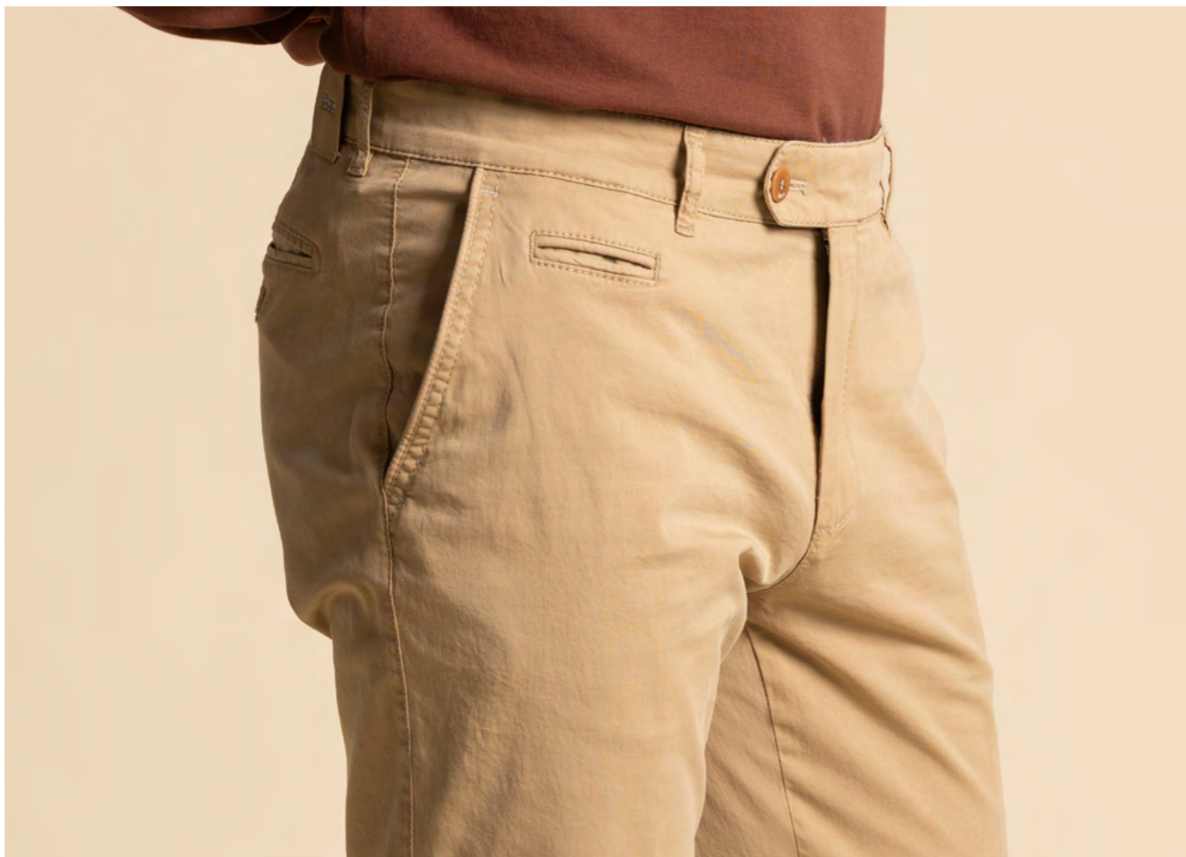
Brax Bomuldsbukser 1.000 kr.