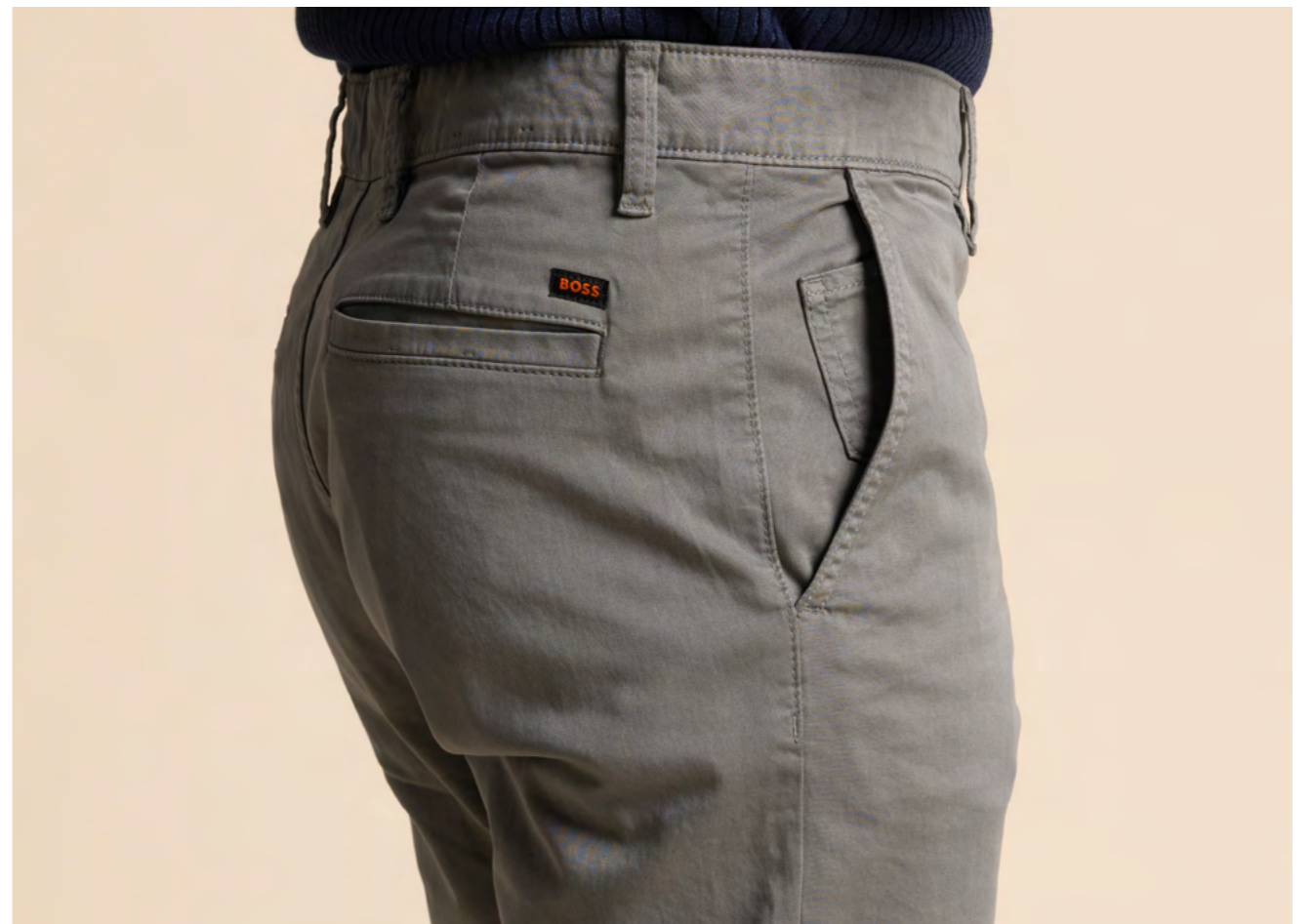
BOSS Bomuldsbukser 949 kr.