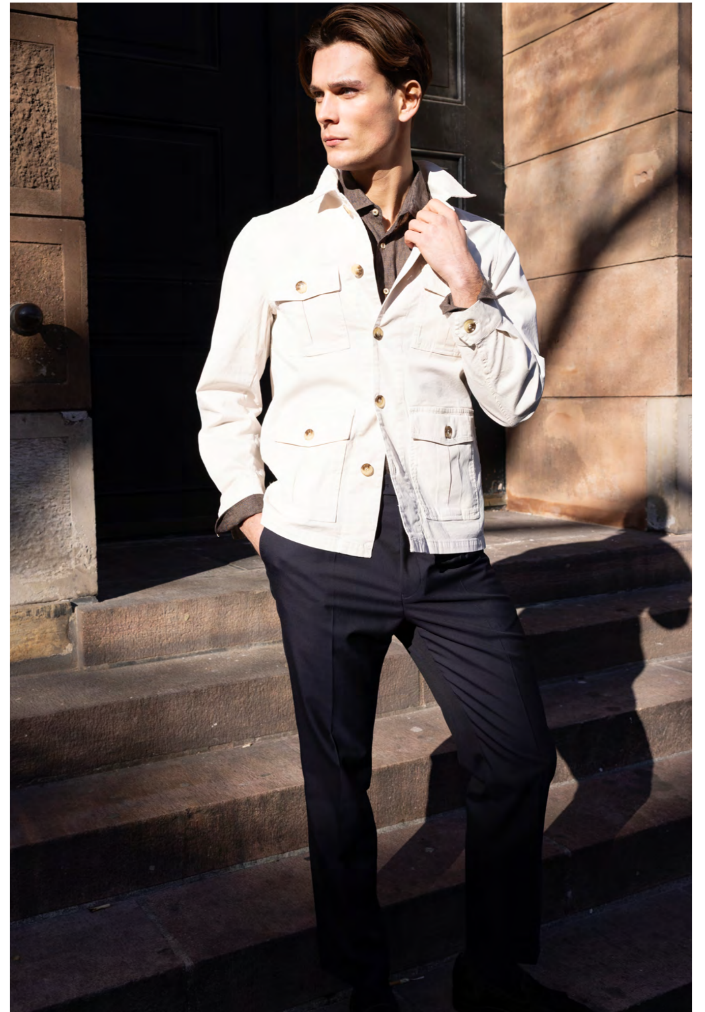
Oscar Jacobson Skjortejakke 1.600 kr.