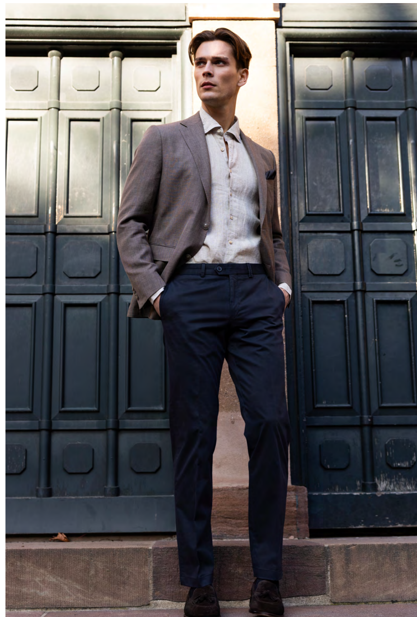
Dressler Blazer 5.900 kr.