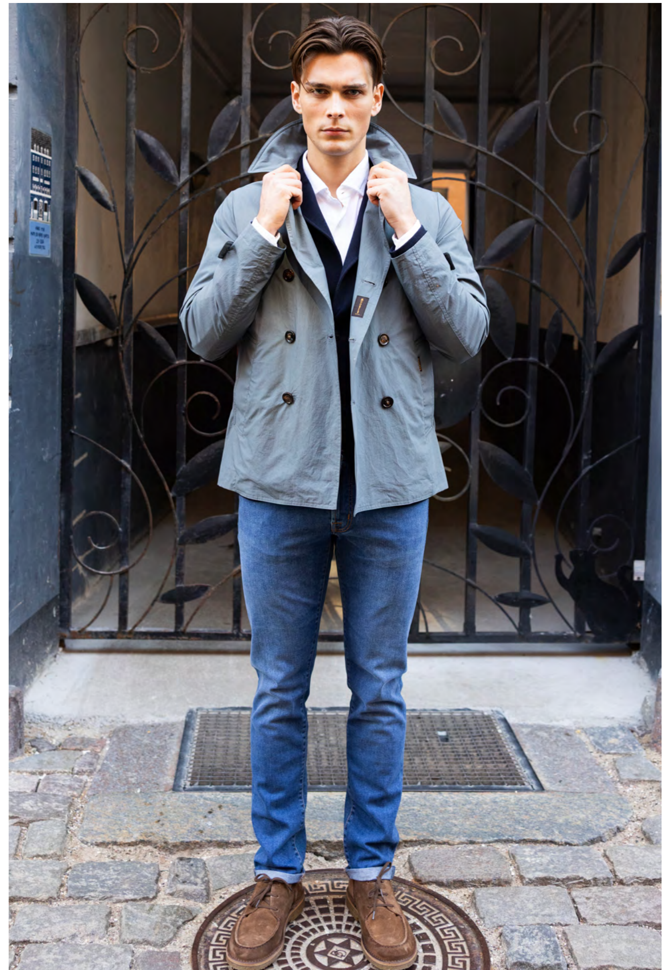
MooReR Jakke 8.600 kr.