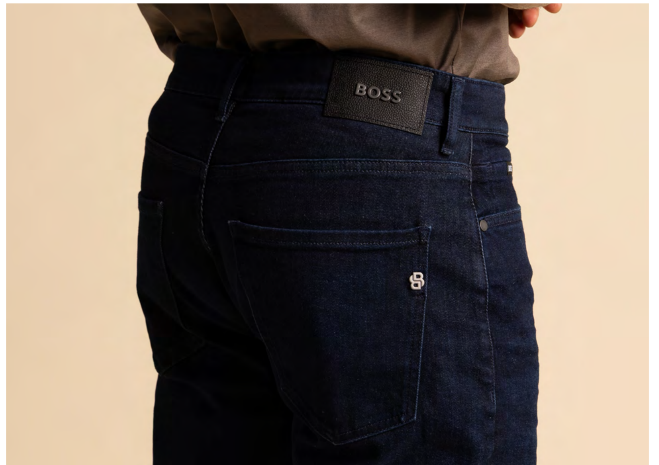
BOSS Jeans 1.400 kr.