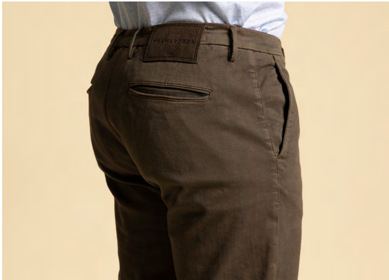
Tramarossa Bomuldsbukser 2.500 kr.