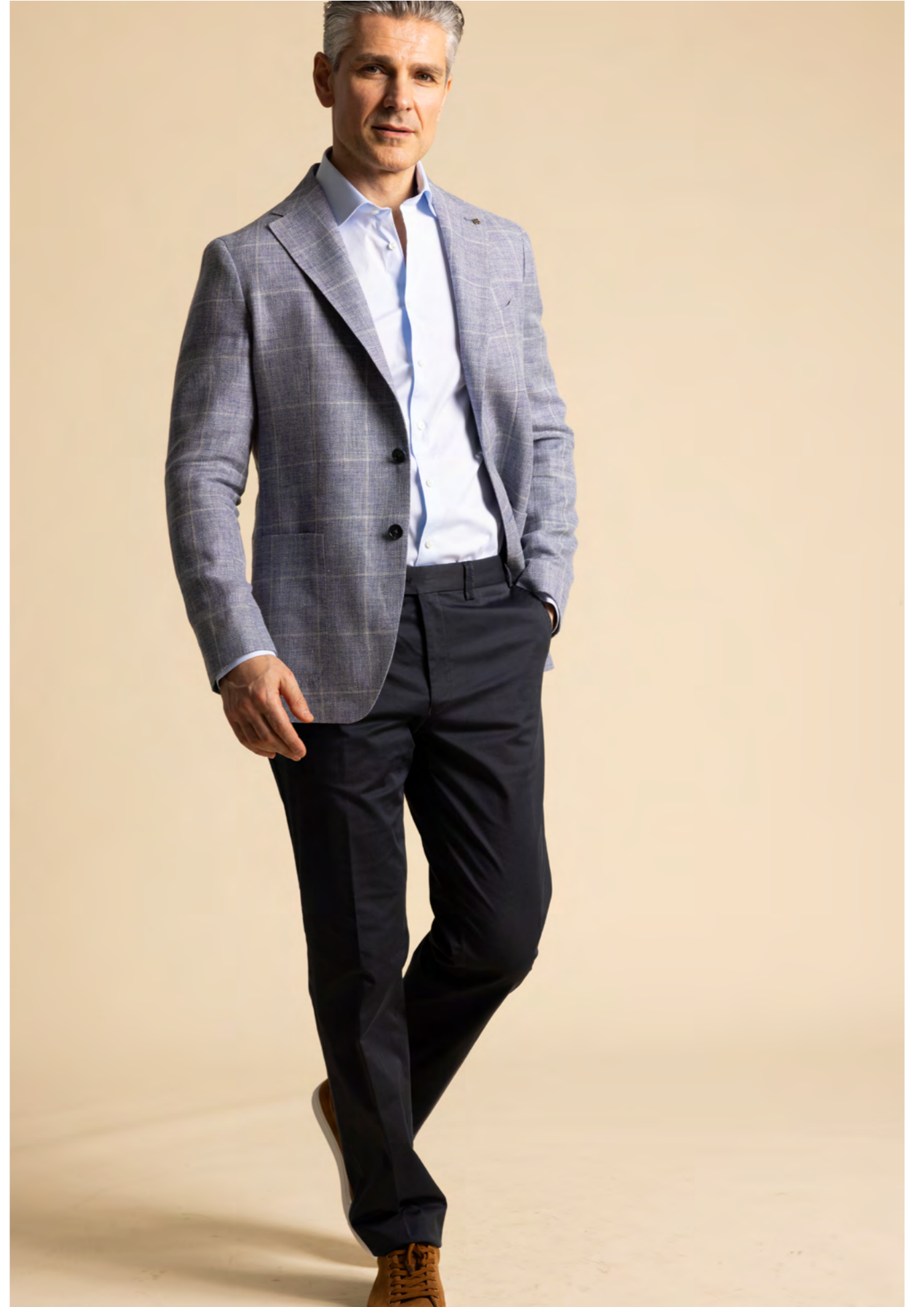
Tagliatore Blazer 5.200 kr.