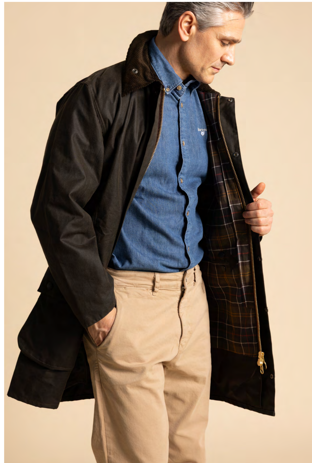
BARBOUR Jakke 3.200 kr.